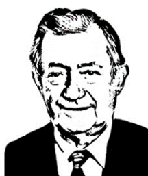
Centro Ricerche Toni Destro A.P.S.